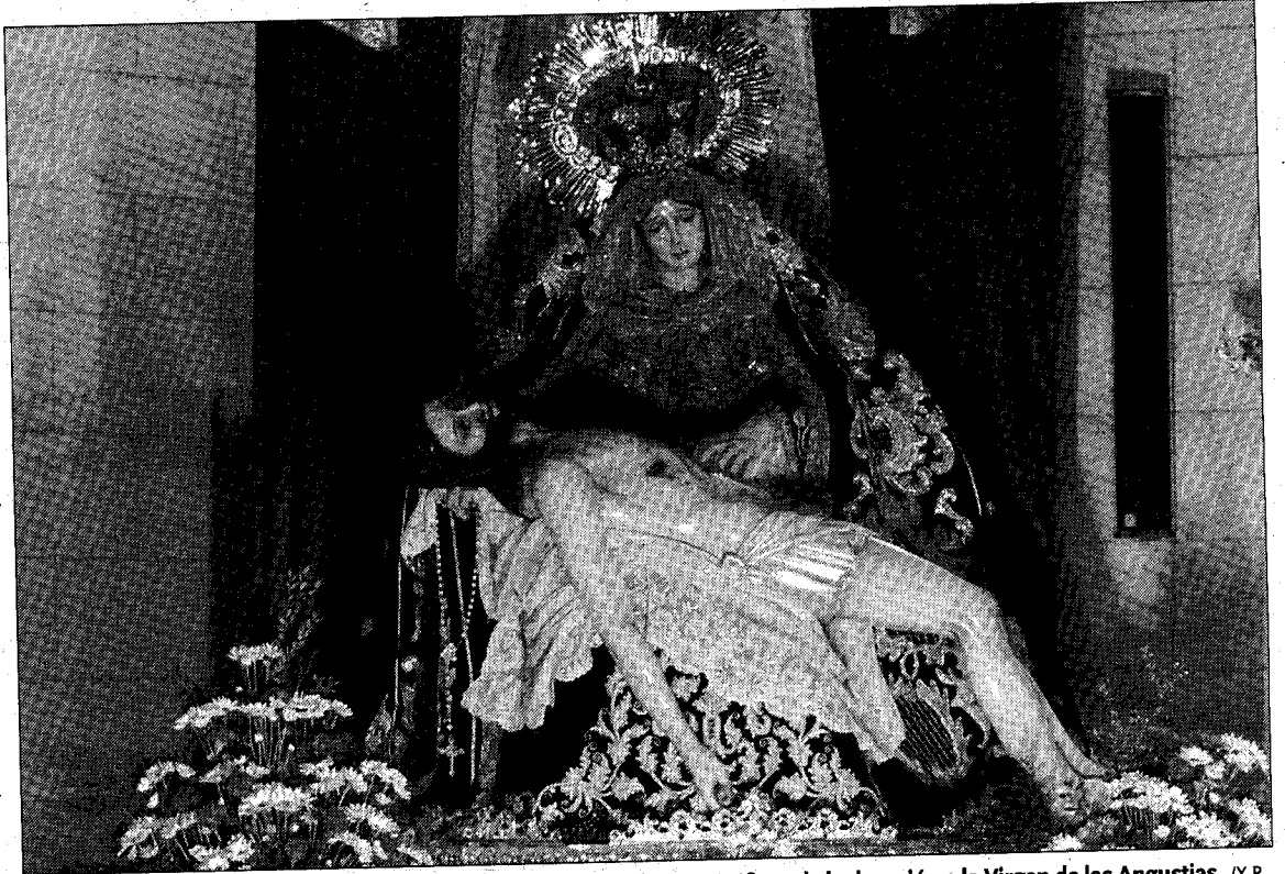
En la última sesión del primer ciclo se analizarán los elementos iconográficos de la devoción a la Virgen de las Angustias.

La sesión de mañana martes abordará dos fuentes históricas para el conocimiento de los santuarios: las Relaciones Topográficas ordenadas por Felipe II y las colecciones de relatos de milagros. El miércoles se estudiarán los santuarios de la Hispania prerromana. La tercera y última sesión se dedicará al presente, analizando los elementos iconográficos de la devoción actual a la Virgen de las Angustias y las prácticas religiosas en los santuarios